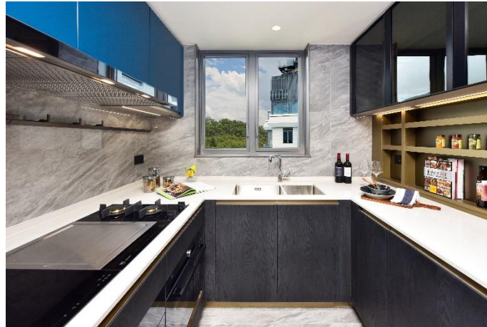
圖片7： Sky Le Pont廚櫃配以意大利進口的Binova Ocean Blue色系展現雅緻品味。