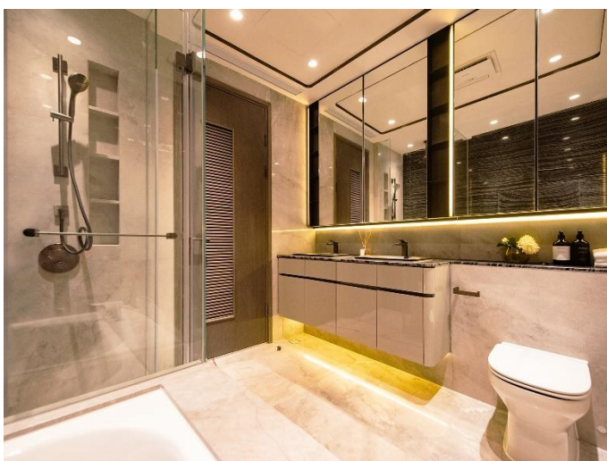
圖片3：Garden Duplex主人套房衛浴採用美國品牌KOHLER之Shagreen系列水漫式藝術面盆，配搭意大利經典品牌GESSI水龍頭設計。