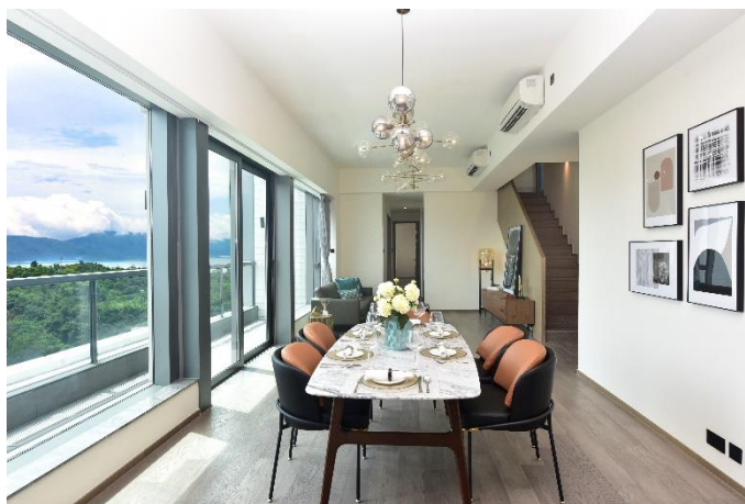
圖片5: Sky Le Pont設特大客飯廳，住戶於私人平台及天台，可將翠綠山巒或蔚藍海景映入眼簾。