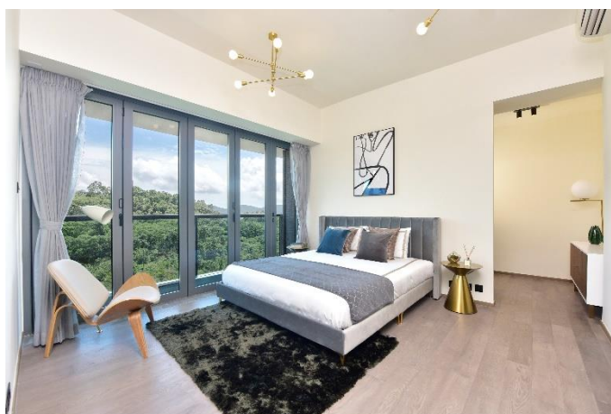
圖片6: Sky Le Pont主人套房寬敞舒適，衣帽間位置更設有V-ZUG衣物管家 (Refresh Butler)。