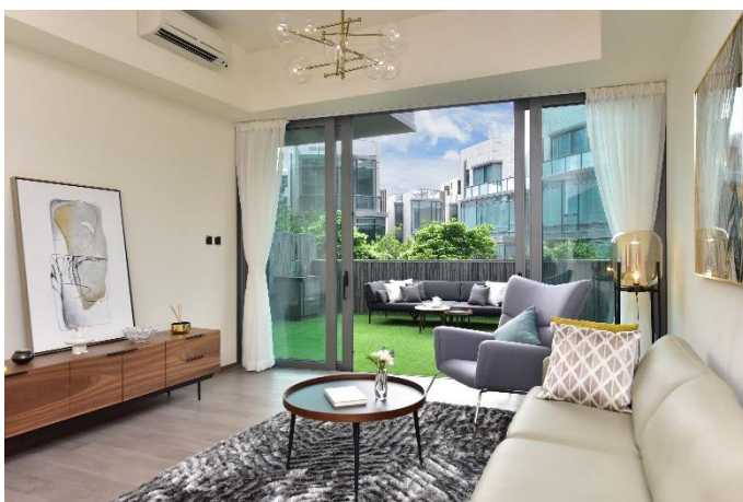
圖片2：Garden Duplex下層大廳、客房及廚房均接連花園，亦設內置獨立樓梯直達雙車位，方便住戶出入。